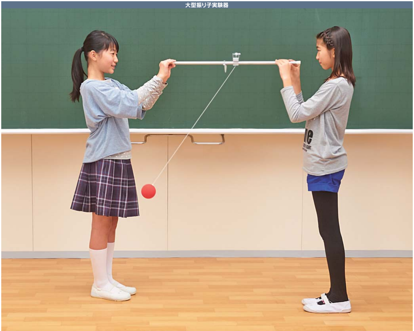
大型振り子実験器