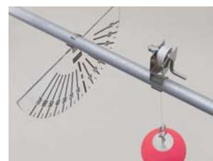
支持棒にワンタッチで取り付けることができます。