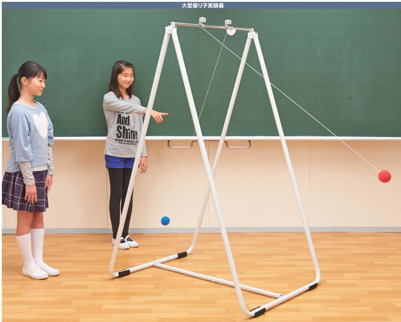
大型振り子実験器