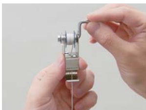
リール付なので、巻き取りが簡単です。