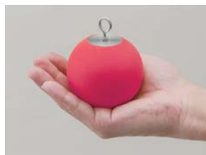
安全に考慮したやわらかい材質のおもり。